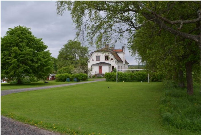
Nuvarande Mårtensård i Löa