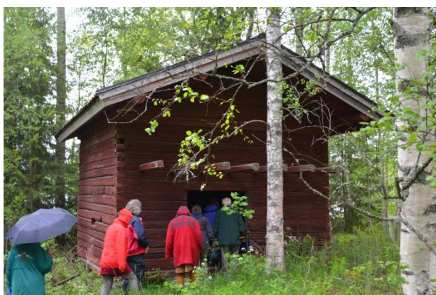
Den mystiska ria