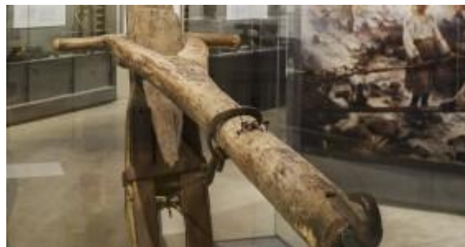
Skogsfinnska utställning i Lusto