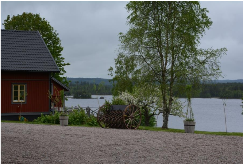
Näset i Ljusnaren